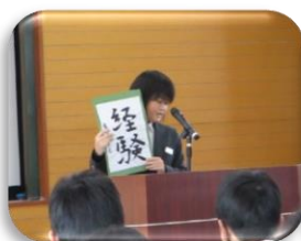
各クラスの代表生徒による決意表明(作文発表)