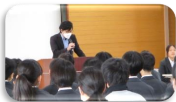
立志式についての説明を聞きました。