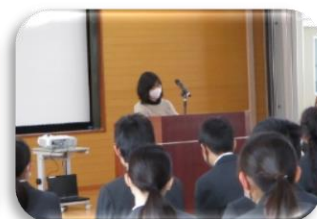
PTAからの激励の言葉